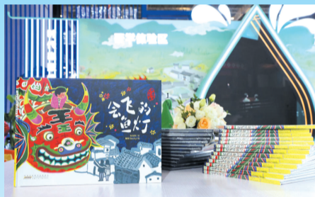
根据绘本开发“点亮鱼灯 看见徽州”研学活动