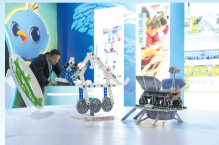
丰富课程让学生既“研”又“学”