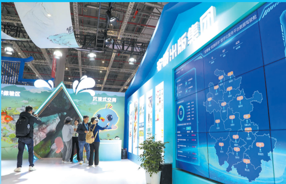
安徽出版集团携优质内容亮相文博会