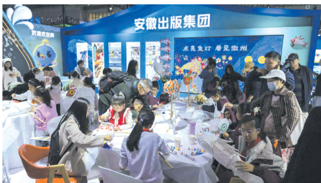
根据绘本《会飞的鱼灯》开发“点亮鱼灯 看见徽州”研学活动

从历史名城到自然风光,从传统技艺到现代科技,既有徽文化等经典内容,也纳入科技创新体验,让学生在实践中感悟安徽魅力,传承文化精髓。通过挖掘各地最具特色文化内涵,安徽出版集团携手安徽十六市文旅部门创建了“一市一品、特色研学”主题品牌,展示了地方的山水、人文、科技等,助力各地市共建省级研学精品课程资源库,实现了全省优质课程资源互通共享,丰富了研学旅游的产品供给,进一步擦亮了“研学安徽”的品牌。