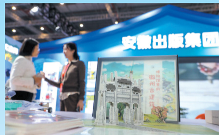
《博物馆里的徽州古建筑》普及徽派建筑知识