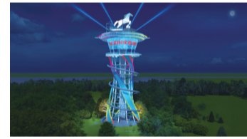
博望区红阳村马场

美丽横山： 漫游“蓝宝石”水库特色风光带 向阳水库位于横山景区内，一池碧水静静躺在山洼间，好似镶嵌在山间的一块蓝宝石。