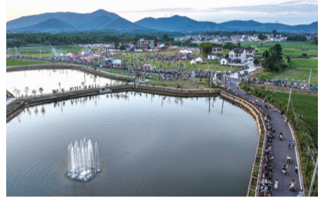
博望镇山宁村土塘自然村