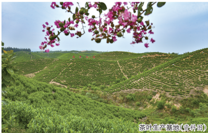
茶叶生产基地(资料图)

产业发展中,公司积极鼓励帮助周边干群、返乡创业青年因地制宜发展,建成了万兴村春谷仙白茶基地、程垅栀子花基地等。白茶产业的发展更让