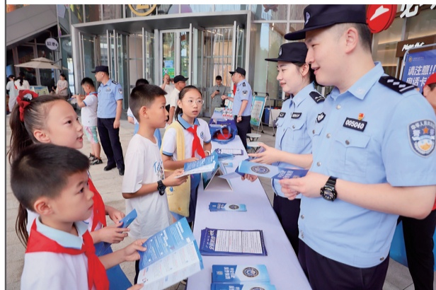
6月26日,合肥市瑶海区开展禁毒宣传活动,活动主题“防范青少年药物滥用”,来自辖区各单位近千人参加了活动。活动现场设置了宣传台、宣传展板,还抽取观众上台进行禁毒知识问答。 吴兰保 刘贤峰

针对毒情变化,合肥公安禁毒部门把此类新型毒品治理作为今年“清源断流”行动攻坚任务之一,重点整治涉“笑气”、含依托咪酯和合成大麻素“上头电子烟”以及麻精药品三类突出问题,循线打掉了一批非法生产场点,摧毁了一批跨区域团伙网络,全力遏制蔓延态势和社会危害。同时针对青少年等群体和娱乐场所、学校周边等重点部位,加强新型毒品危害宣传,增强识毒防毒意识和能力。