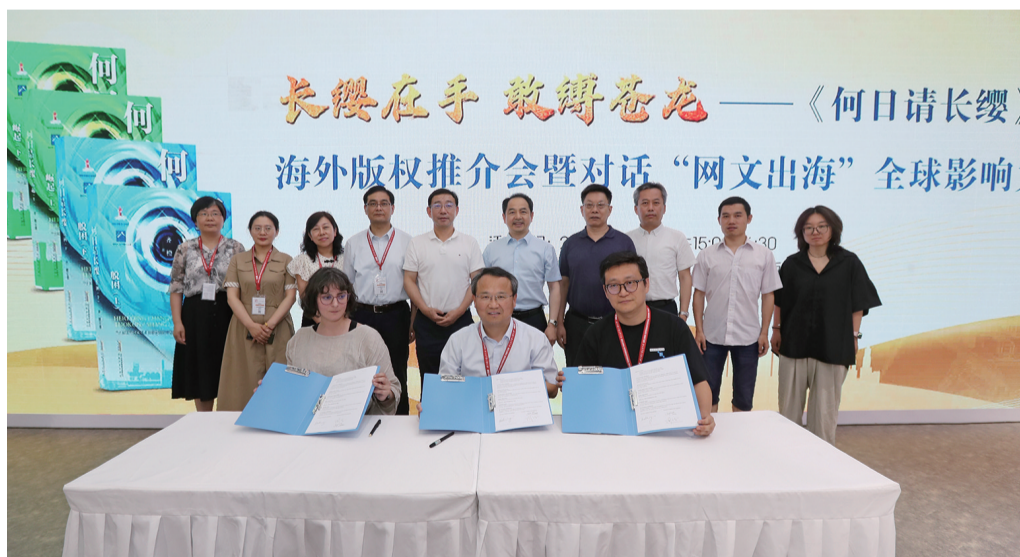
《何日请长缨》海外版权推介会暨对话“网文出海”全球影响力活动签约仪式现场

星报讯(记者 徐越蕾/文) 6月19日,第30届北京国际图书博览会开幕当日,安徽文艺出版社的《何日请长缨》海外版权推介会暨对话“网文出海”全球影响力活动在安徽馆精彩亮相。