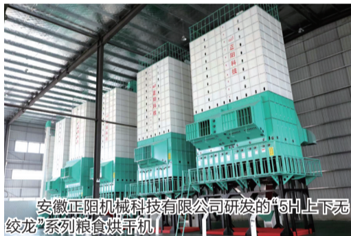
安徽正阳机械科技有限公司研发的“5H上下无绞龙”系列粮食烘干机