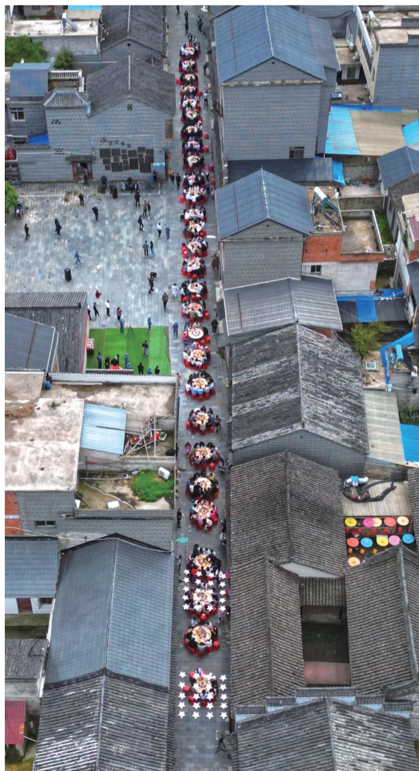
汤家集镇长街宴活动

近年来,六安市坚定不移走工业强市之路,大力推进工业企业壮大、主导产业集聚、园区创新升级工程,实施制造业高质量发展行动,推动工业经济实现质的有效提升和量的较快增长。一组数据见证成绩:从增速看,2023年全市规模以上工业增加值增长7.8%,高于全省0.3个百分点,居全省第5位。全市工业投资增长31.5%,高于全省8.8个百分点,居全省第5位;制造业投资增长48.6%,高于全省28.6个百分点,居全省第2位。从效益看,规上工业利润总额增长28.6%,高于全省21.5个百分点,居全省第3位。今年1至2月,全市战略性新兴产业产值增速达10.1%。