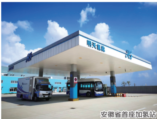
安徽省首座加氢站