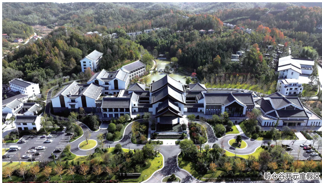
聆心谷开元度假区

格恩半导体率先实现国内氮化镓激光芯片的规模量产;正阳机械成为国内最大的粮食烘干机制造商之一;明天氢能参与了国内首座兆瓦级氢储能电站的建设;长街宴携手“十万剧场”呈现红色文化之旅……近日,记者跟随“筑梦现代化 共绘新图景”采访团在六安市金安区、金寨县采访看到,当地因地制宜发展新质生产力,奏响工业、文旅“协奏曲”,为革命老区发展注入新活力。