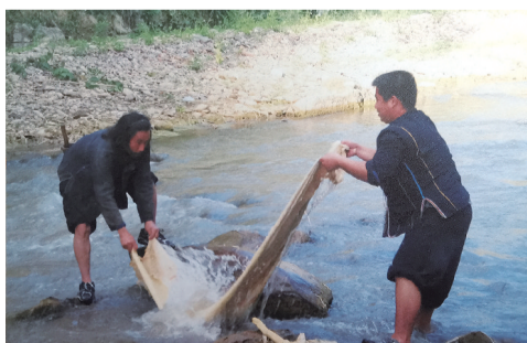
洗去杂质，留下纯粹