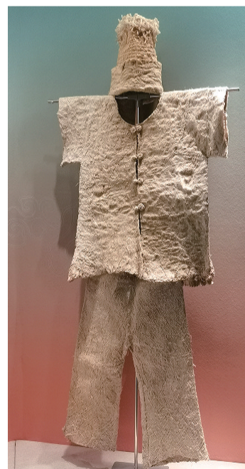
用剧毒的箭毒木树皮做的树皮衣

达中美洲后，被当作纸来使用，赋予其文字记载的功能，这对中美洲的历史产生了深远的影响；树皮衣是人类早期服饰的活化石，是中国对世界衣服系统的伟大贡献。