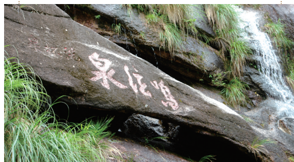
唐李白题鸣弦泉石刻