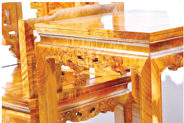
金丝楠木家具