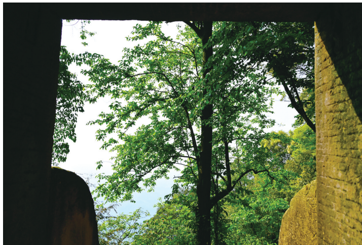
喜温暖湿润环境的金丝楠木

总而言之，单从最终获得的价值来说，说一棵金丝楠木能卖上亿元或许有些夸张，但想靠金丝楠木挣钱并非全无道理。那么，为什么没见多少人种呢？