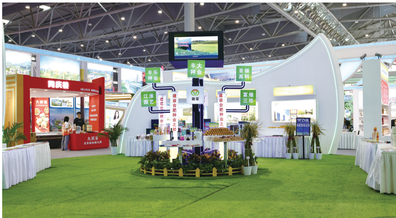
合肥市展区展示的产品

此外,本届农交会将突出全产业链经营,突出全要素对接,升级产业招商生态地图,16个市及绿色食品产业专班成员单位围绕产业规划、产业生态、招才引智、信息统筹以及常态化运营编制招商地图,发布推介“双招双引”重点项目。同时,邀请网红达人现场直播带