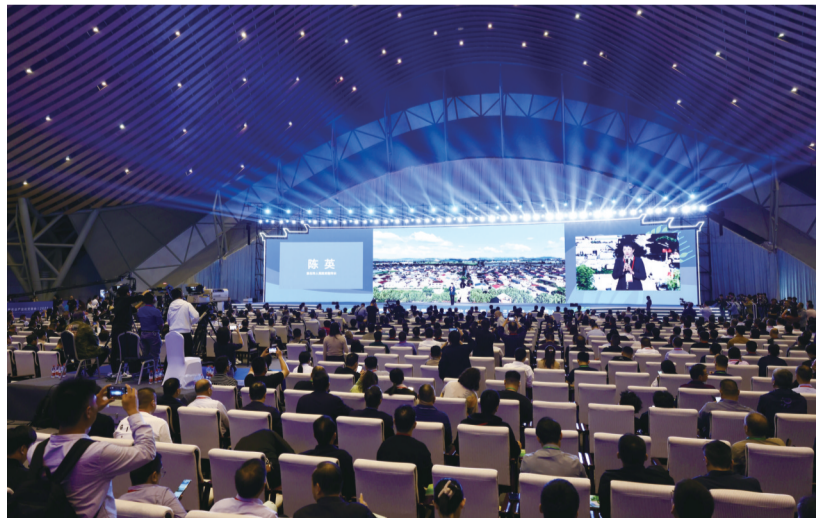
“塑品牌 招项目 促融合”市长推介会现场

金秋十月,五谷丰登、瓜果飘香,在这个丰收的美好时节,各位市政府负责同志带来许多丰富的绿色优质的农特