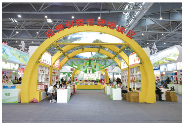
展会现场招商洽谈区