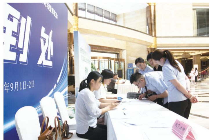
8月31日,来自全国各地的参展商陆续抵达合肥。

记者了解到,本届展会将充分展示安徽养老事业和养老产业发展成果以及长三角养老一体化发展情况,积极发挥健康养老产业“双招双引”交流平台作用,百家养老机构(企业)将在现场开展项目合作和交流,促进全省养老事业和产业高质量发展。