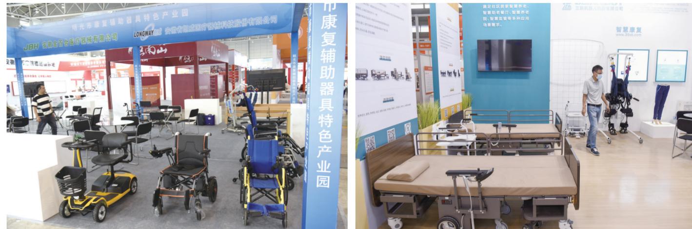
各类康复辅助器具