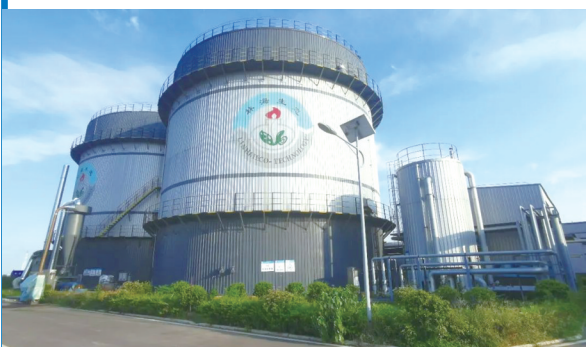
阜南县苗集乡生物天然气生产处理站点，秸秆在此变废为宝，化身绿色能源

明媚夏日，金色的丰收、绿色的能源、多彩的文旅，共同绘就江淮大地乡村振兴的缤纷画卷。作为国有大行，建行安徽省分行将不断提升金融服务乡村振兴的高度、宽度、力度、温度和韧度，助力产业蓬勃发展，助力村民共同致富，助力新时代乡村美好生活。来源：中国建设银行安徽省分行