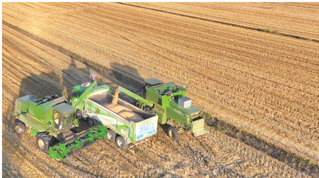
安徽省宿州市埇桥区夹沟镇小麦收割现场

宿州分行、淮南分行为客户种植、收购粮食提供信贷支持，是建设银行安徽省分行为乡村振兴注入金融“活水”的缩影。建行安徽省分行通过不断加大金融产品供给，努力解决包括农户在内各类涉农主体的融资难题。截至目前，建行安徽省分行农户贷款较年初新增67