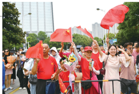
6月16日，中考结束前合肥八中门口前来迎接考生的家长们挥舞着国旗。

语文学科独特的学科性质决定了语文教学不能是暴风疾雨式的灌溉，而只能是春雨随风潜入夜的浸润。由“谁见幽人独往来”之“幽人”自然联想到“履卦”中“幽人贞吉”，自然想到苏轼被贬黄州这种无可奈何的孤独以及自我疗伤的幽怨。“缥缈孤鸿影”之“孤鸿”而联想到“孤鸿海上来”，又何尝不是此时对先贤张九龄在政治斗争中那种孤独的突然理解。凡此种种，皆是语文。