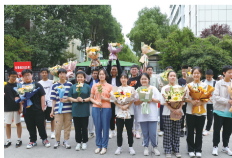
6月16日，中考结束后合肥八中门口合影留念的考生们。