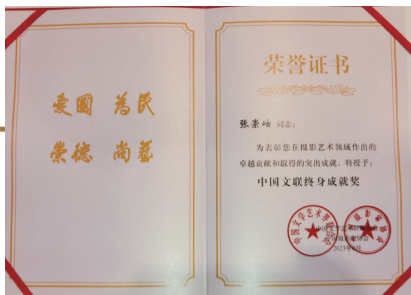
中国文联终身成就奖获奖证书