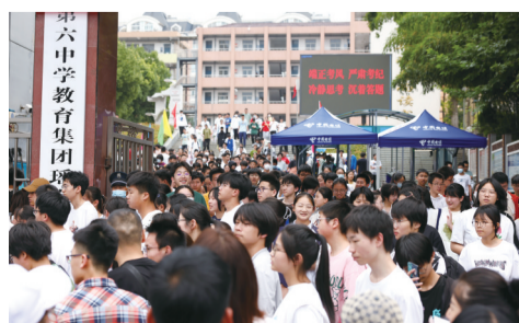
英语考试结束，缓缓走出考场的考生，标志2023年中考结束。