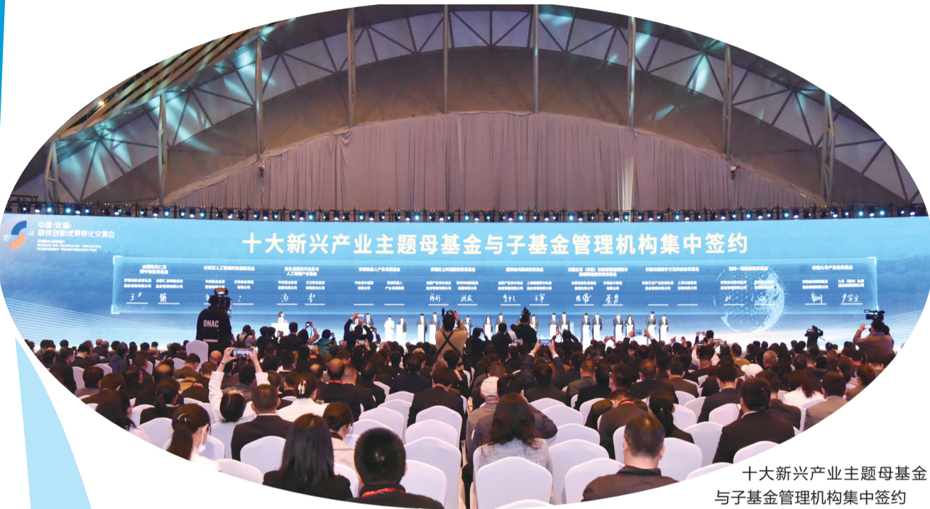
十大新兴产业主题母基金与子基金管理机构集中签约