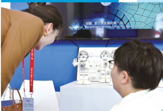
观众现场观看悟空机器人表演