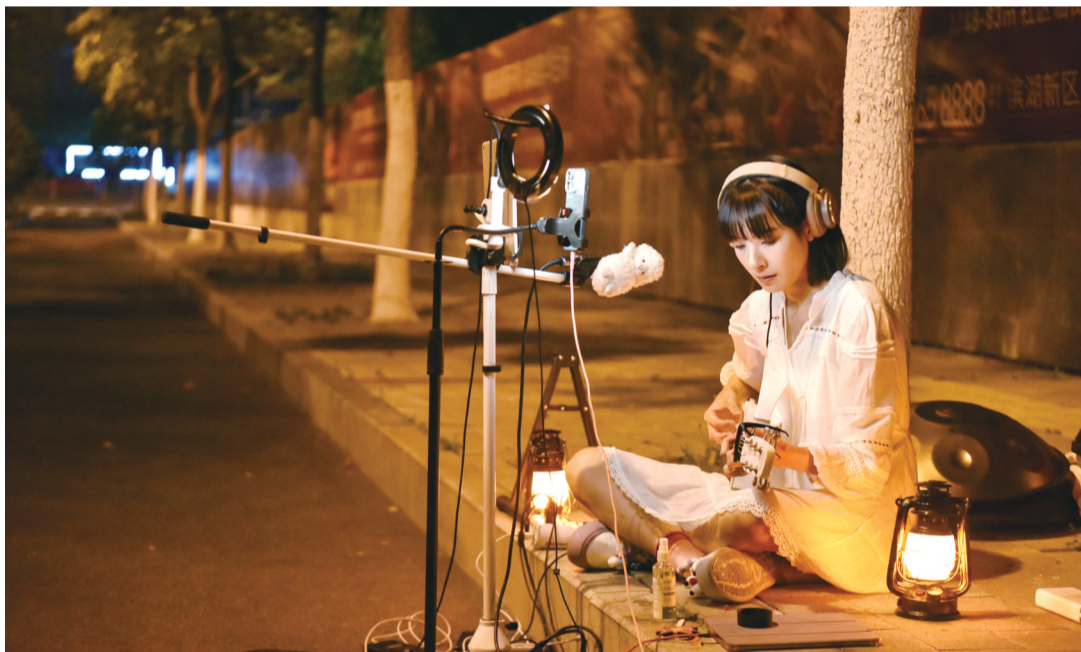
关鱼鱼深夜在街头直播