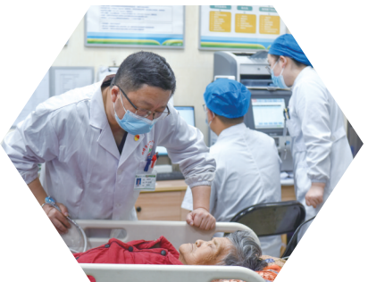
呼唤病人,查看病人意识是否健全