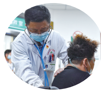
帮助患者进行检查,查看病情