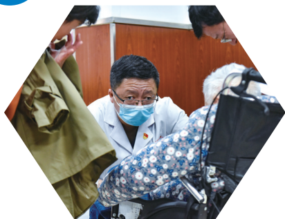
主动观察病人情况,准确对病情进行判定