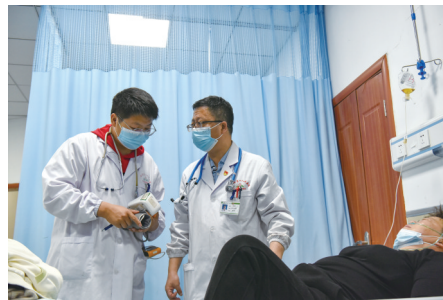
叮嘱夜班医生治疗注意事项