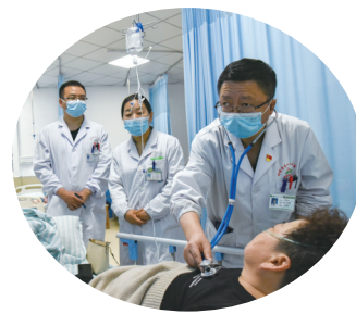
早晨带着医务人员查房