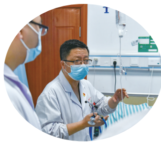
指导年轻医生,对治疗方案进行说明