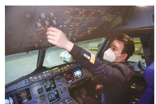
1月7日,东航安徽分公司在合肥新桥机场的第一班航班飞行员在做航前准备