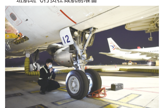
合肥新桥国际机场停机坪,飞行员在做航前检查