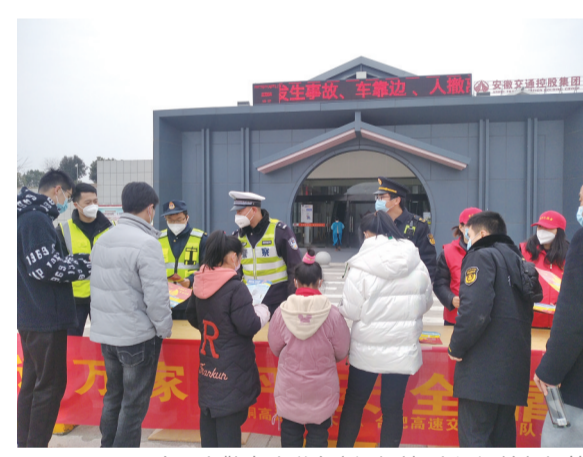
1月7日,合肥交警支队联合客运站、交通运输部门等搭建春运交通安全宣传服务台,开展春运出行安全宣传提示

合肥客运机场巴士有4条线路从市区前往新桥机场。分别是1号线去程:客运总站-柏景假日酒店-机场,回程:机场-大西门-三孝口-巢湖路-明光路汽车站-客运总站;2号线去程:百花井-六安路-机场,回程:机场-十六所-双岗-百花井;3号线去程:高铁站-机场,回程:机场-客