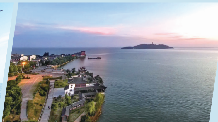
中庙与姥山岛隔水相望