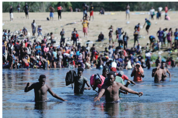
非法移民走过美墨边境的里奥格兰德河(资料图片)。

据新华社电(记者 孙丁) 美国联邦最高法院27日举行表决，维持一项针对越境移民的快速驱逐令。