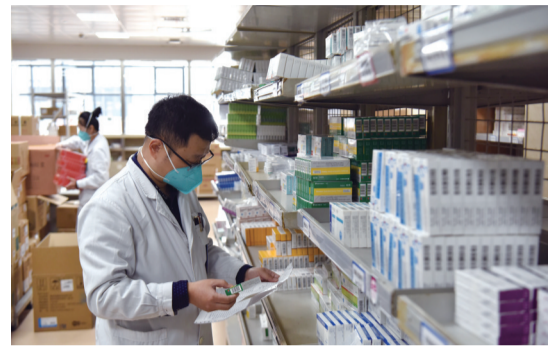
第一人民医院药剂师正在核对药品