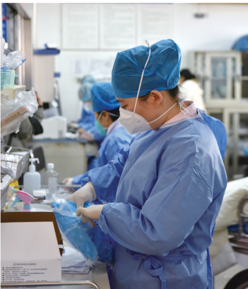
急诊室内忙碌的护士