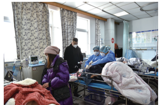
医护人员正在对病人进行救治

再冷的严冬都会过去,春天的阳光就要到来。致敬坚守阵地的勇士,白衣天使,我们一定能打赢这场仗。