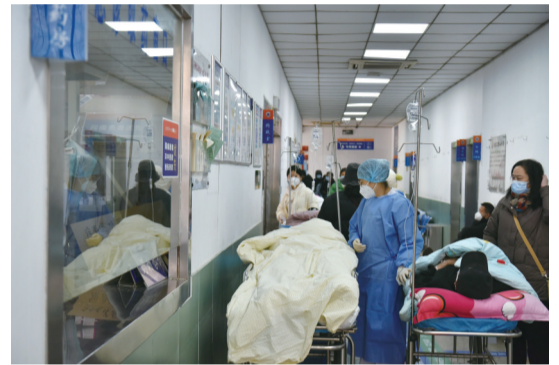
急诊的走廊上还不断地有病人前来就诊