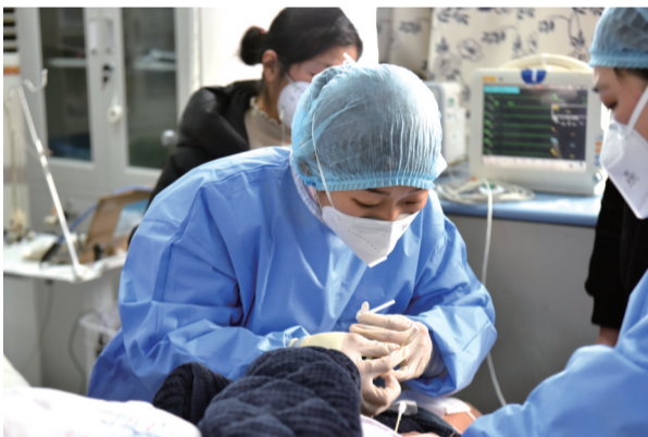
急诊室内医护人员正在对病人进行救治