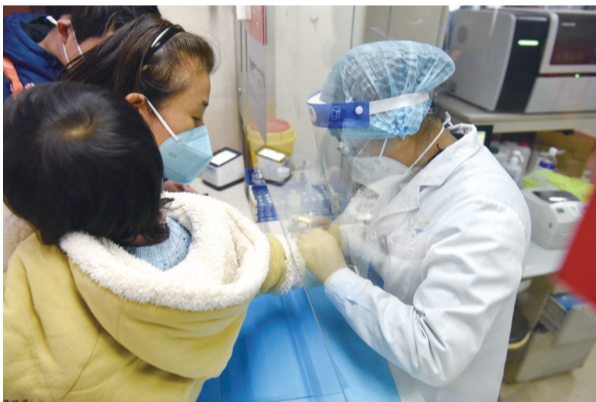
滨湖医院检验科为患者做检查

12月23日,在安徽省新冠肺炎疫情防控工作第七十四场新闻发布会上,安徽省卫生健康委主任陶仪声通报安徽省疫情最新情况。安徽省根据愿检尽检核酸检测阳性率、居民自测抗原阳性率、发热门诊就诊患者数和阳性检出率等监测数据综合分析,近日安徽省疫情仍处于上升阶段,但上升速度在逐渐减缓。陶仪声称,根据数学模型预测,结合专家评估判断,预计安徽省大部分地区将在月底前达峰,并在高位维持2~3天后,进入下降通道。