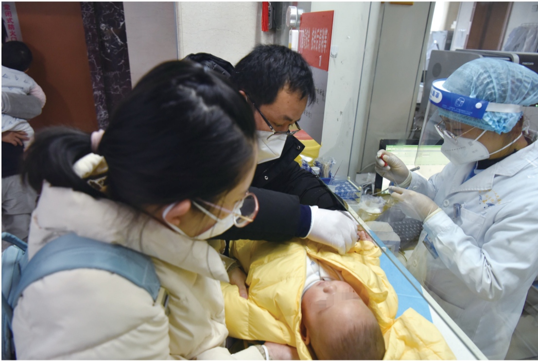
滨湖医院急诊医生正在给患者看病