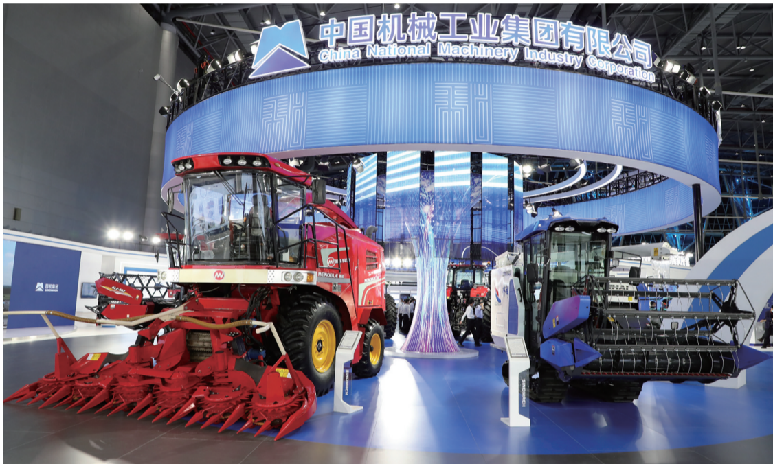
中国机械工业集团有限公司展区展品

风起云涌长三角,安徽制造正当时。党的十八大以来,安徽坚定不移实施制造强省战略,实现从“传统农业大省”到“新兴工业大省”,再到“加快打造制造强省”的蝶变。蓬勃发展的制造业,成为安徽在全国经济发展格局中进阶进位的关键支撑。