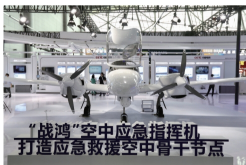
“战鸿”空中应急指挥机