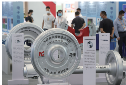
马钢展出的高速动车轮样品