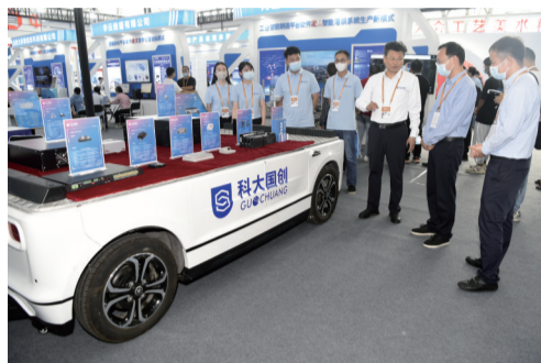
科大国创智能线控平板车智能移动平台

大国制造,气象万千。从深海的“奋斗者”号成功万米坐底,到蓝天的C919大型客机取证试飞,再到升空的嫦娥探月、祝融探火、羲和逐日、北斗组网……大批重大标志性创新成果引领中国制造业不断攀上新高度。