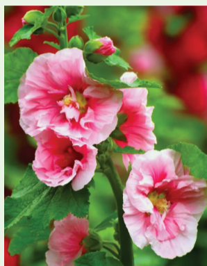
一丈红(蜀葵) 锦葵科锦葵属