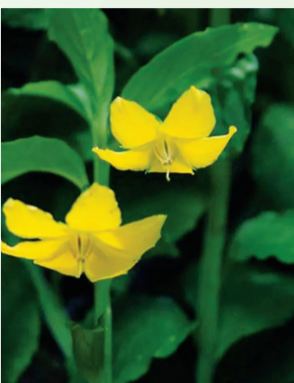
零陵香 报春花科报春花属