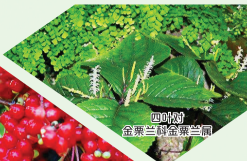
四叶对 金粟兰科金粟兰属