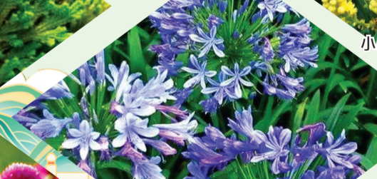
百子莲 石蒜科百子莲属