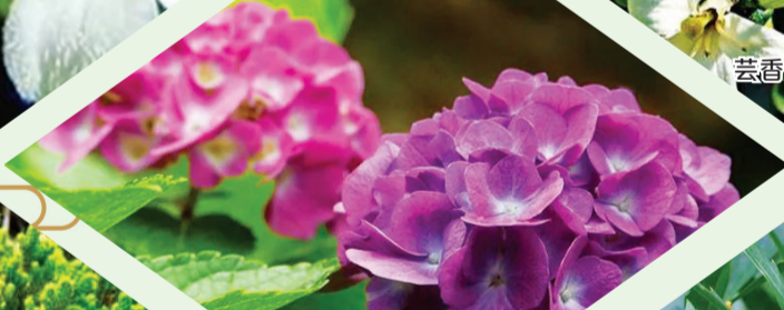
八仙花 虎耳草科八仙花属