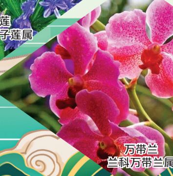
万带兰 兰科万带兰属