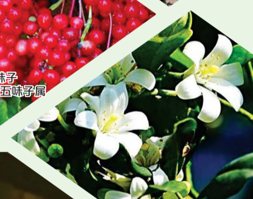
七里香 芸香科九里香属