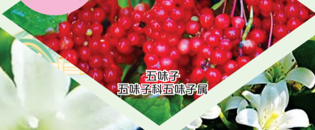
五味子 五味子科五味子属