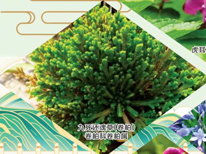
九死还魂草(卷柏) 卷柏科卷柏属