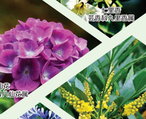
十大功劳 小檗科十大功劳属