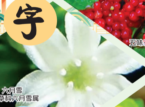
六月雪 茜草科六月雪属