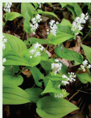
二叶舞鹤草 百合科属舞鹤草属