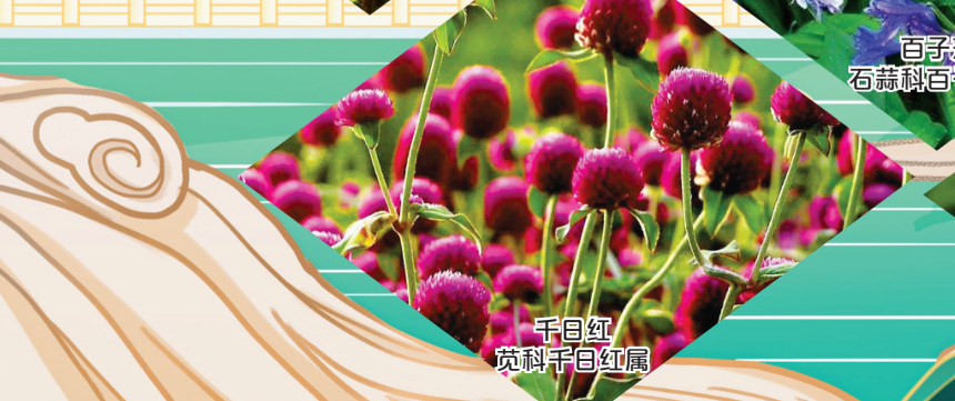
千日红 菊科千日红属