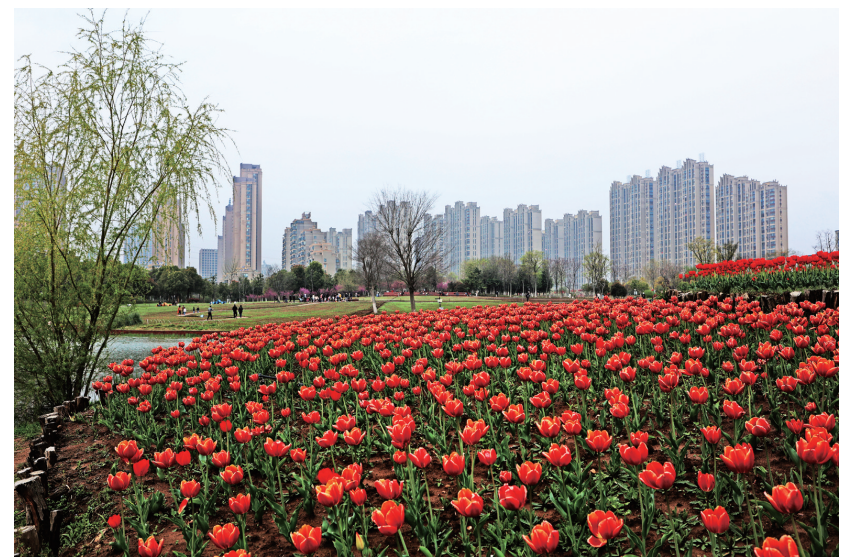
位于合肥蜀山经开区的四季花海吸引了众多的游人