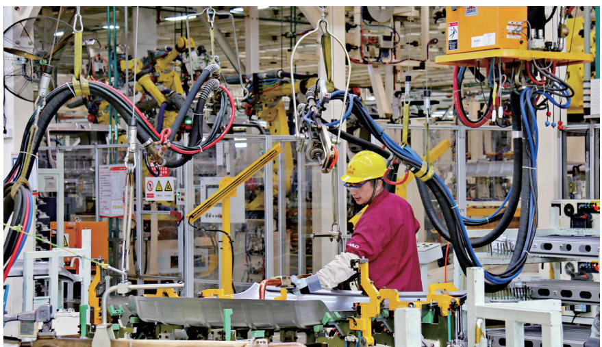
肥西经开区江淮轻卡生产线

2022年3月31日,均胜汽车安全项目在肥西经开区正式动工建设,建设内容包括智能生产车间、智能研发中心、智能物流中心等,项目一期计划2023年底投产,达产后年税收不低于8000万元,年产值不低于25亿元。