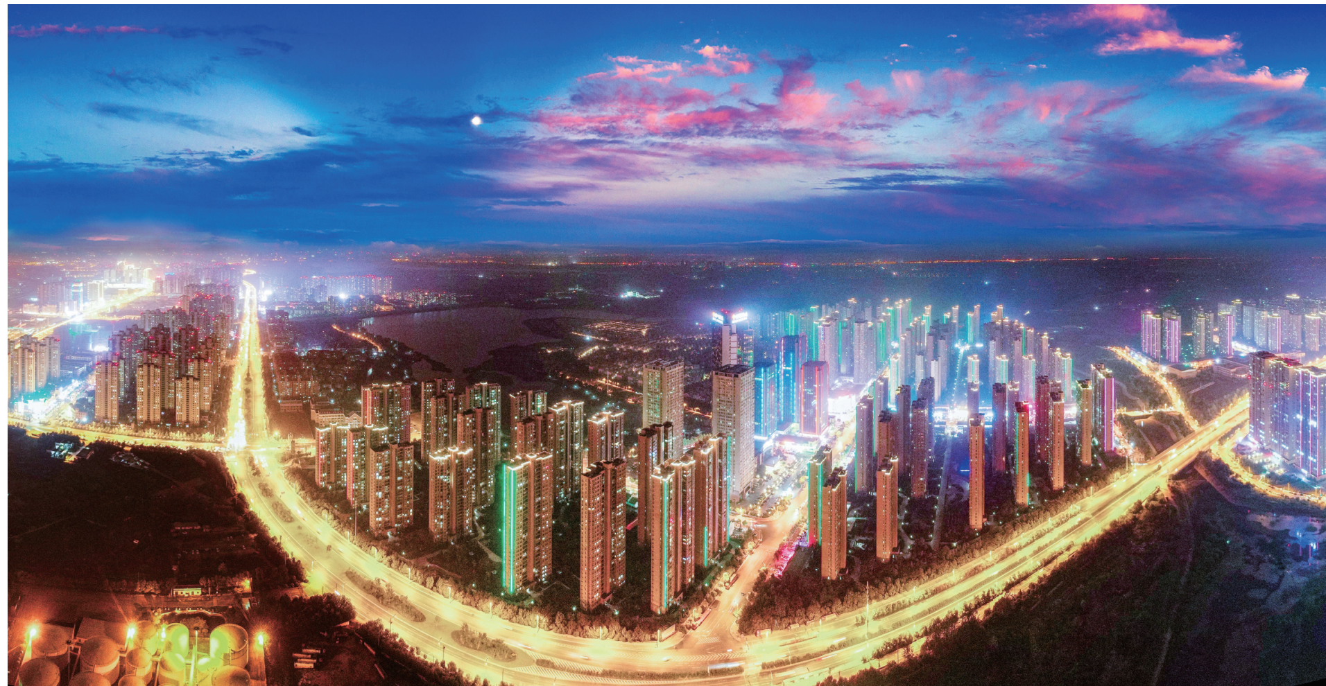
长丰(双凤)经开区