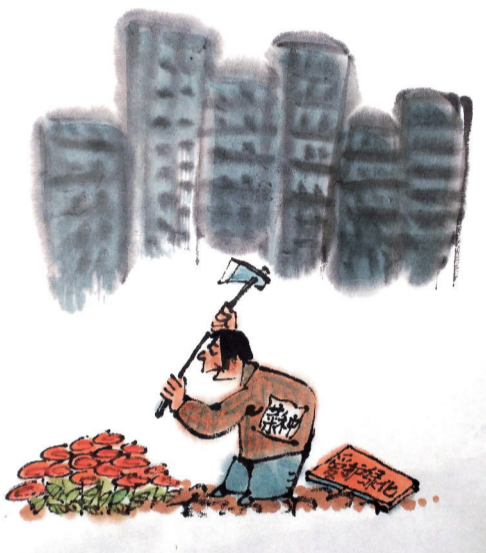
选错了地方 ■ 王恒