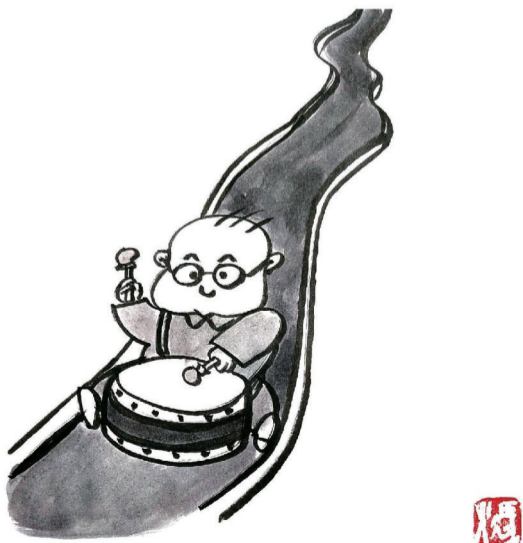
谁说我不会乐器？我退堂鼓打的可好了!