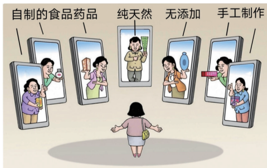
网上泛滥的自制产品 ■ 王少华