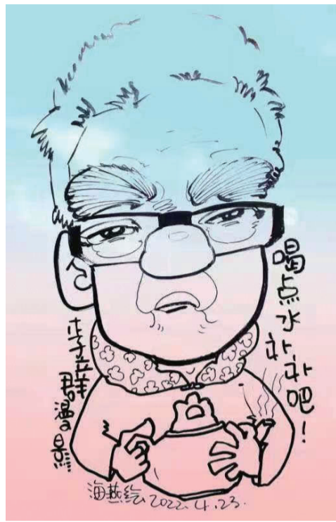
演员李立群漫像 ■ 张海燕