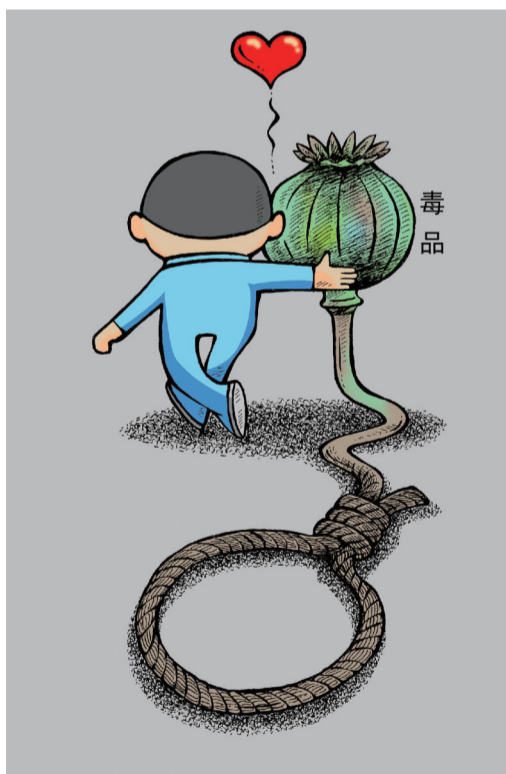
危情 ■ 杨树山