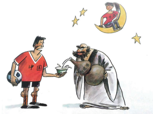
重振雄风 ■ 方唐