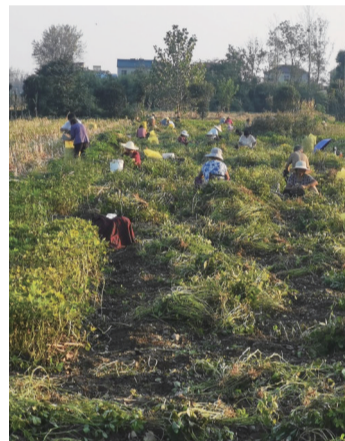
三星村高油脂花生丰收