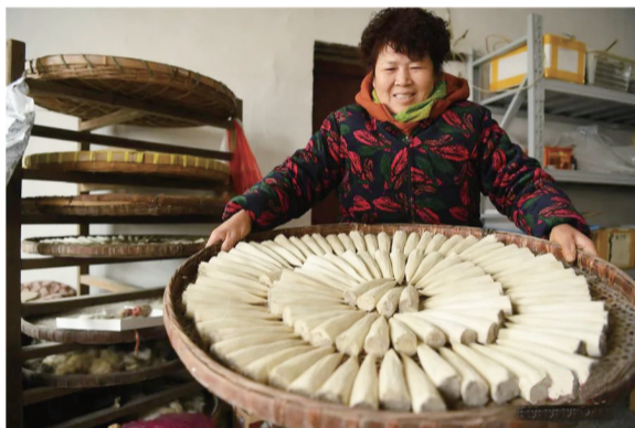
制笔工人准备晾晒制作的笔头。