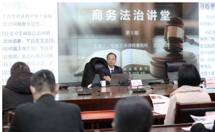
安徽省商务厅开展“商务法治讲堂”