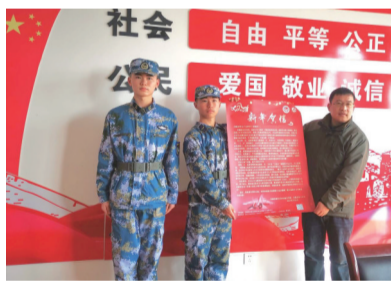
安徽省海军青少年航空学校贺信