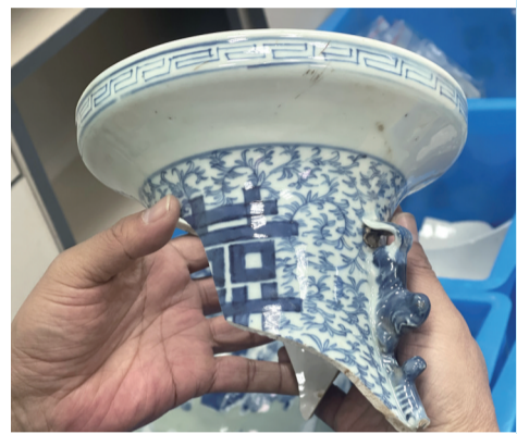
“长江口二号”古船出水文物(资料照片)。