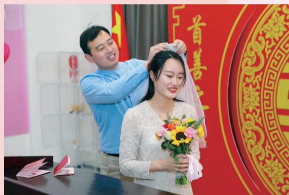
当天登记结婚的新人