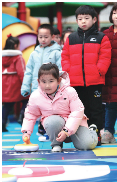
安庆路幼儿园开学典礼上孩子们举行旱地冰壶、旱地冰球等趣味游戏