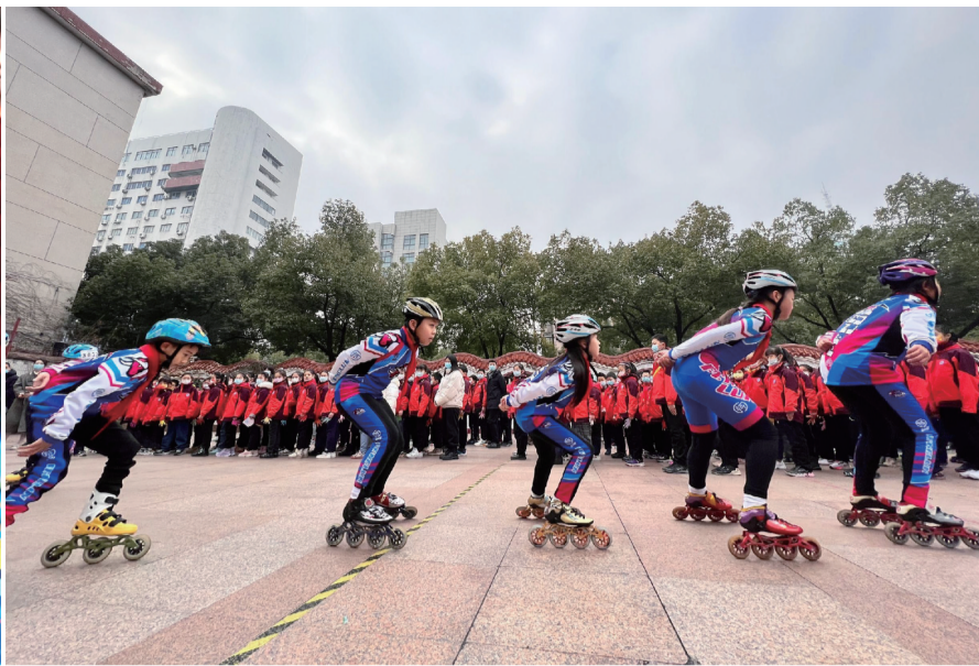
合肥市六安路小学冬奥主题开学典礼