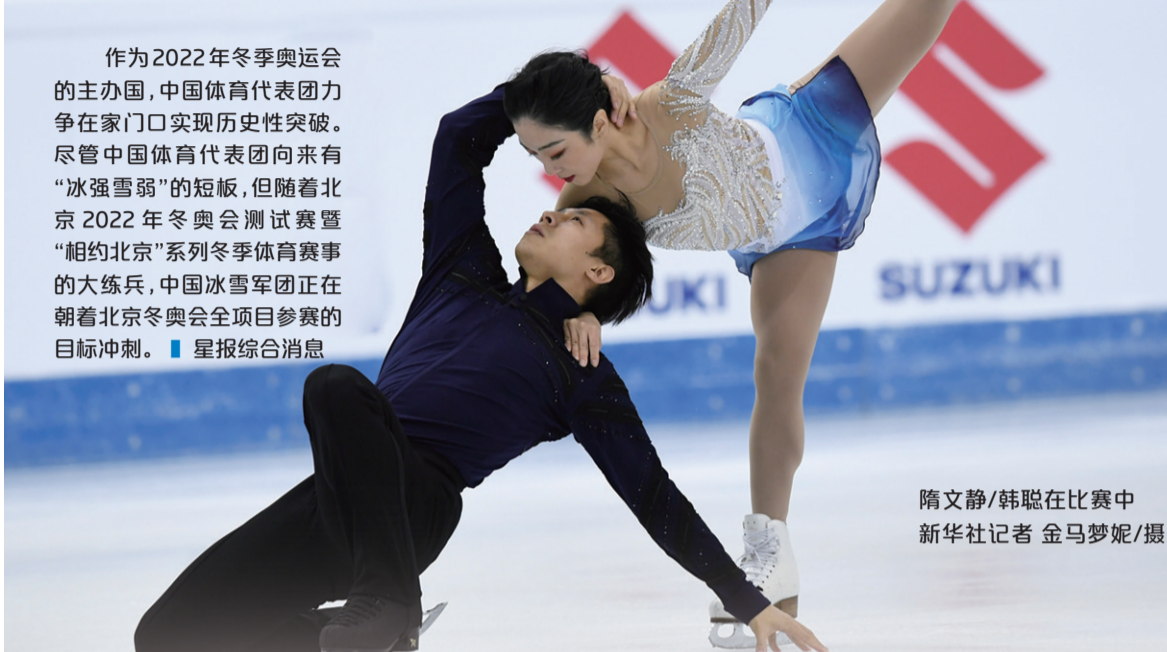
隋文静/韩聪在比赛中

作为2022年冬季奥运会的主办国，中国体育代表团力争在家门口实现历史性突破。尽管中国体育代表团向来有“冰强雪弱”的短板，但随着北京2022年冬奥会测试赛暨“相约北京”系列冬季体育赛事的大练兵，中国冰雪军团正在朝着北京冬奥会全项目参赛的目标冲刺。■星报综合消息