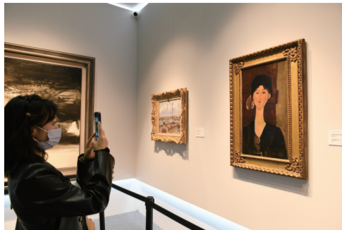
价值上亿的油画首次走进“进博会”