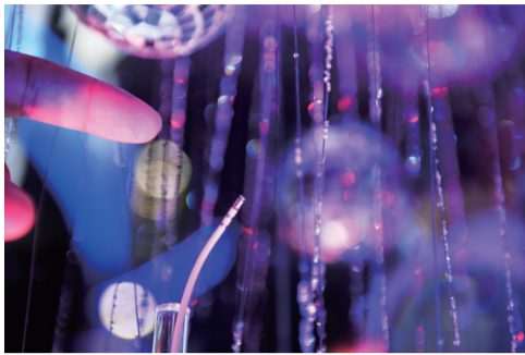
钻石头消融导管亚洲首秀