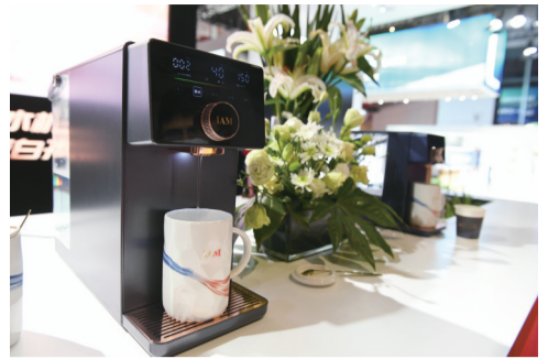
智能家电，3秒喝上凉白开