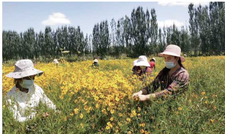
安徽援疆实施乡村振兴提升补助项目——皮山县克里阳乡村民正在忙碌于雪菊田里

根据中央部署,安徽省对口支援新疆和田地区皮山县。安徽援疆指挥部坚持顺应民意、保障民生、凝聚民心,坚持全面援疆、精准援疆、长期援疆,紧密结合和田地区皮山县实际,2017年以来,财政援疆资金20亿元,实施援建项目162个。先后选派420名干部人才,柔性引进200余人次教育、医疗、农业、建筑、交通等专业技术人才赴疆援建。扎实推进安居、就业、消费、结对等帮扶措施,帮助完成158个村、31024户、118935人全部脱贫,助力皮山县于2020年成功摘帽。 ■记者 秦缘