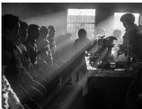
肥东团县委举办集体婚礼