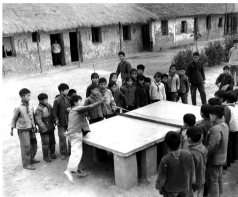
上世纪六十年代肥东农村小学校园