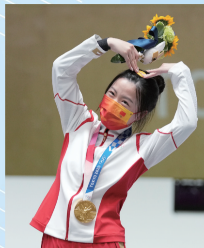
女子10米气步枪比赛中杨倩(2000年出生)夺得东京奥运会首枚金牌

拿到东京奥运会首金的杨倩是2000年出生，两次战胜伊藤美诚的孙颖莎同样是一位标准的“00后”。在男子10米气步枪中拿到银牌的盛李豪比前面两位还要小上4岁。