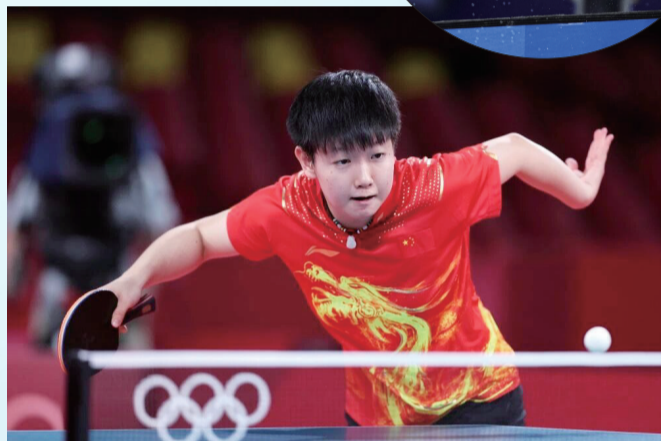
8月5日，中国队选手孙颖莎(2000年出生)在比赛中