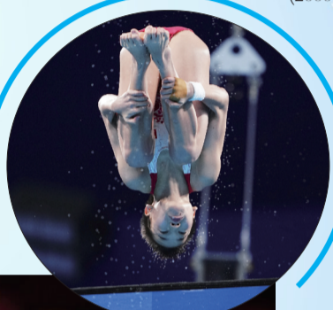
► 中国选手全红婵(2007年出生)在跳水项目女子10米跳台决赛中