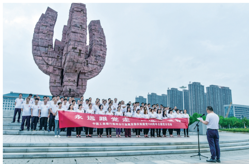
6月18日,工行滁州分行直属党委组织开展“永远跟党走,奋进新征程”主题党日活动。

心向滁州,奔向未来。从小微个体到万千产业,从每一笔小的生意到每一个大的生活,工商银行滁州分行秉承“工于至诚,行以致远”理念,陪伴着滁州社会经济全面发展的点点滴滴。