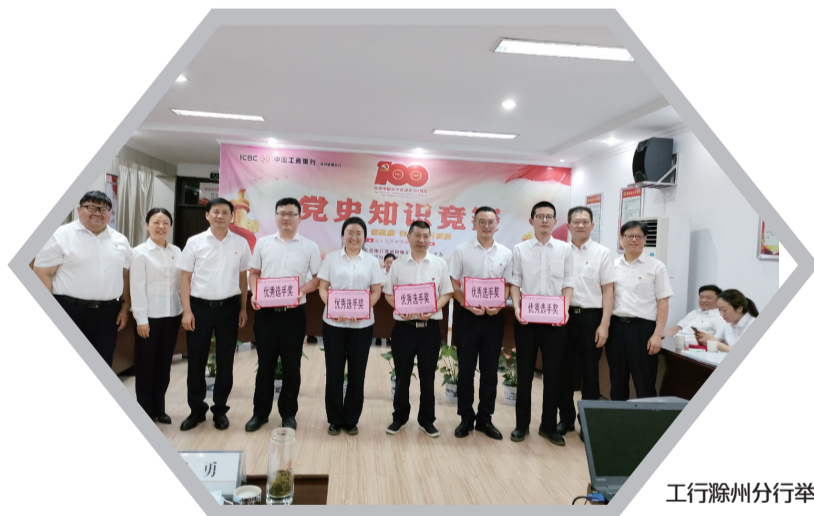
工行滁州分行举办党史知识竞赛

2020年,中央文明委下发有关文件,继续保留工行滁州分行等单位“全国文明城市”荣誉称号。