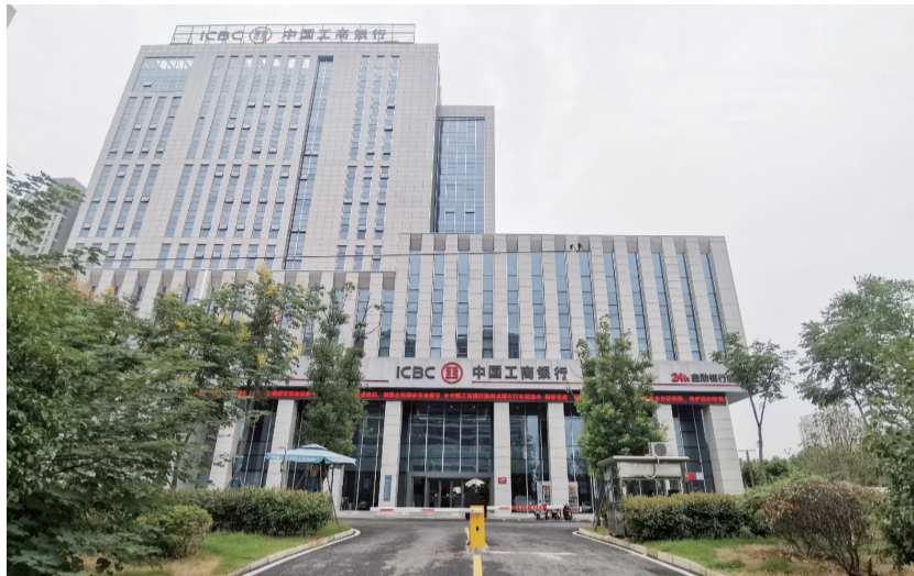
工行滁州分行新大楼