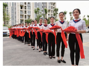
工行滁州分行持续加大员工文明礼仪培训,树立文明规范服务良好形象。