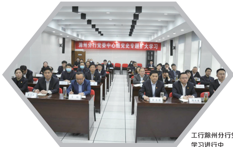
工行滁州分行党委中心组党史专题扩大学习进行中