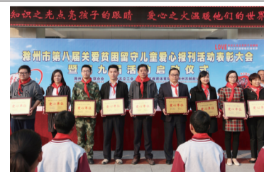
工行滁州分行连续多年订阅爱心报刊资助留守儿童

为庆祝中国共产党成立100周年,6月26日,工行滁州分行在凤阳小岗村开展“奋斗百年路,启航新征程”红色接力跑活动。