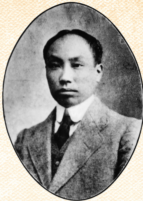
陳獨秀，安徽懷寧人。新文化運動的主將、中國共產黨的主要創始人和早期主要領導人

1921年中國共產黨成立，中國革命的面貌從此煥然一新。1923年冬，安徽第一個城市黨組織——中共安慶支部成立；安徽第一個農村黨組織——中共小甸集特別支部成立。隨後，安徽各地的黨組織如雨后春筍般紛紛湧現，安徽各地的革命鬥爭似星星之火漸成燎原之勢。安徽地方黨組織始終站在全省革命鬥爭的最前列，團結帶領安徽人民策應北伐戰爭，掀起大革命的高潮；發動武裝暴動、武裝起義，組建工農紅軍，實行土地革命，建立紅色政權；投入全民族抗日戰爭，同日本侵略者奮戰到底，為抗日戰爭和世界反法西斯戰爭的勝利立下了不朽功勳；投身人民解放戰爭，推翻國民黨反動統治，迎來安徽全境解放，為建立新中國付出了巨大犧牲、作出了卓越貢獻。