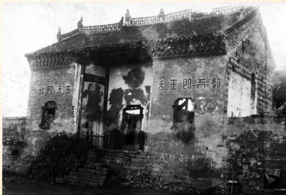
1929年11月17日，六霍起義時期，中共六安六區（今金寨縣）區委在金家寨帝王廟召開群眾大會，宣布六區農民暴動取得勝利，圖為金家寨船舫街帝王廟。