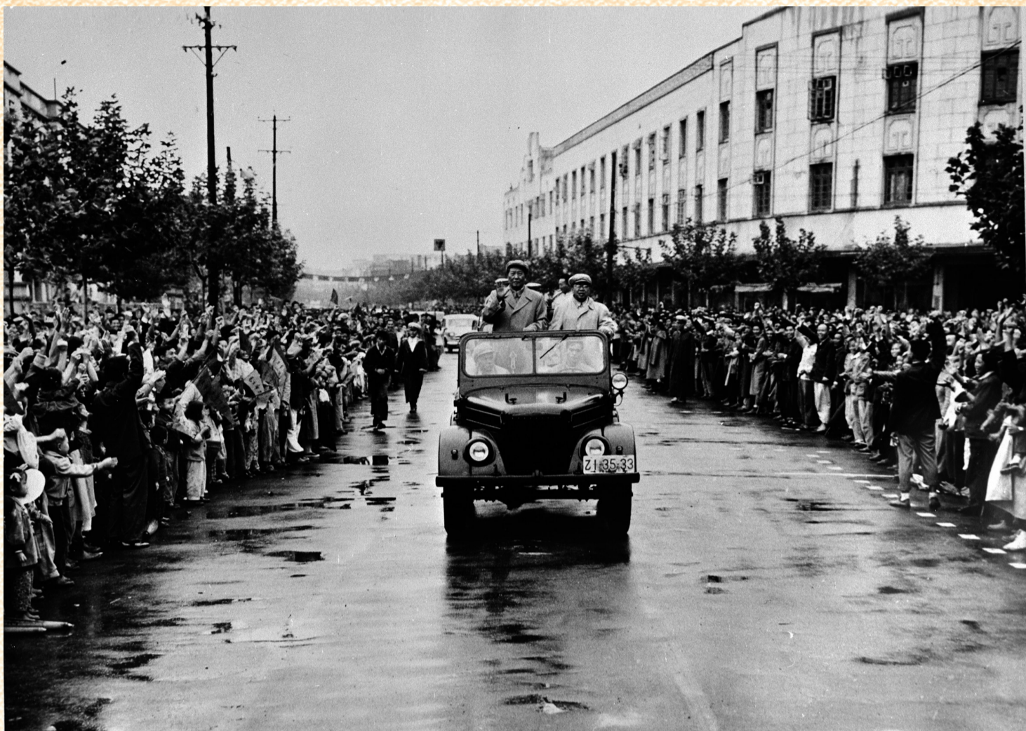
1958年9月19日,毛泽东主席乘敞篷汽车在合肥市长江路上,受到合肥20万群众的热烈欢迎。