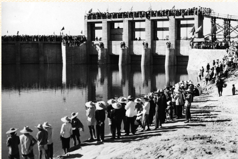
▲1954年，刚刚建成的新中国第一坝——佛子岭水库。