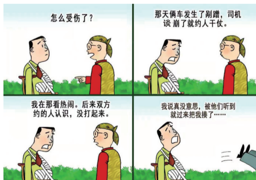
没事找事 ■ 祁雪峰

小启:本版部分文章转载于其他期刊及网络,刊发时无法及时与原作者取得联系,烦请原作者联系我们,以便支付稿酬。联系邮箱:xbmh2020@126.com