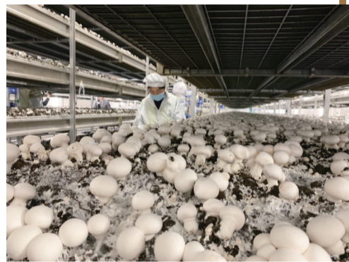
菌床上的双孢菇长势喜人

值得一提的是,该项目2018年1月开工建设,2019年8月正式投产,带动周边乡镇700名农民群众就业。“我们能达到日产60吨、年产2万吨菌菇,消化小麦秸秆15万吨,带动西州店镇高潮、幸福、陈庄等三个贫困村配套建设一个大型秸秆收储中心,预计为村集体经济每年增收约100万元,带动60至