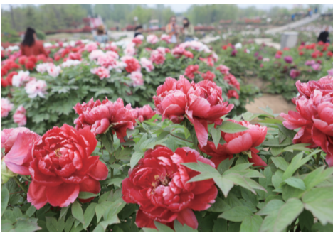
塌陷湿地美 牡丹花开好

星报讯(记者 张倩莹文/图) 淮北市南湖湿地公园位于淮北市主城区南部,西至符夹铁路、东至梧桐路、北至沱河路、南至铁路专用线及烈山大道,总面积为20.05平方公里。其核心景区南湖公园北临沱河路、西临长山南路、南临卧牛