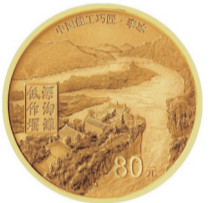
5克圆形精制金质纪念币背面图案

5克圆形金质纪念币背面图案为都江堰水利主体工程，辅以文字“深淘滩低作堰”，并刊“中国能工巧匠·李冰”字样及面额。