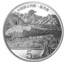
15克圆形精制银质纪念币背面图案

5克圆形金质纪念币背面图案为都江堰水利主体工程，辅以文字“深淘滩低作堰”，并刊“中国能工巧匠·李冰”字样及面额。