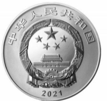
15克圆形精制银质纪念币正面图案

15克圆形银质纪念币背面图案为京张铁路典型工程、火车、经纬仪、长城等造型组合设计，并刊“中国能工巧匠·詹天佑”字样及面额。