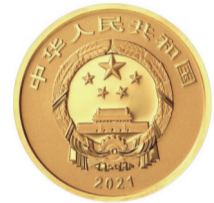
5克圆形精制金质纪念币正面图案