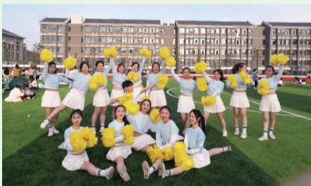
近日，黄麓师范学校第一届啦啦操比赛隆重开幕。