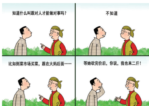
跟对人办对事 ■ 祁雪峰