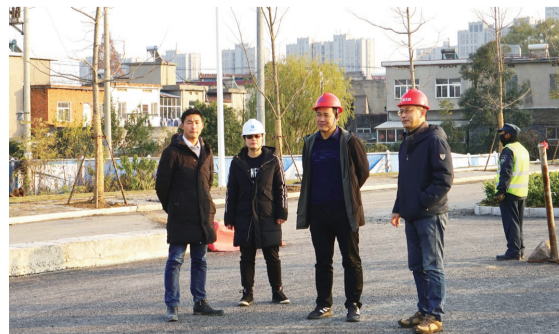
巢湖市重点局负责人现场检查工作

记者近日在巢湖大桥施工现场看到这样的景象:有一群人犹如空中飞人和“蜘蛛侠”,迎着凛冽寒风吊挂在百米高空中辛勤工作,紧张地进行灯饰安装作业,场面无比震撼,他们是巢湖大桥的建设者。