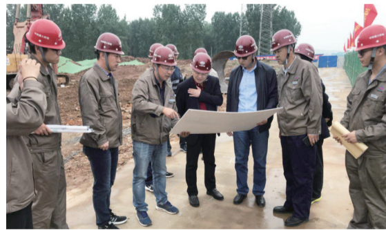
中铁建大桥局领导现场指挥