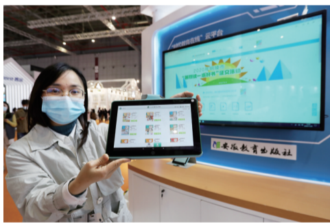
工作人员展示安徽教育出版社线上教育系统

本次参展,集团旗下的安徽省安泰科技股份有限公司特别带来数字文化公共服务方面的相关建设成果。其自主研发的“慧核”平台广泛服务于智慧校园、文化旅游、智慧园区、传播媒体、社区文化建设等,在促进文化与科技融合,实现民众与政府共享、文化与教育互动,提升群众的参与度与满意度等方面有着积极作用。