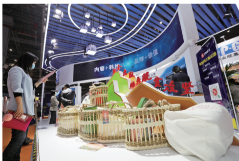
安徽出版集团融合出版助脱贫

数字出版方面,时代听书、富媒体电子书等新产品、新项目纷纷涌现,各呈精彩。其中,时代听书板块依托集团丰富的内容优势,将传统出版和知识服务相融合,隆重推出乐龄听书和文艺有声经典两大听书类产品,分别定位于老年健康和优质经典文学,为读者提供内容优质、形式新颖的“听”书需求。徽风皖韵富媒体电子书项目利用文化与科技融合方式,全方位立体呈现《大别山上》《黄梅小镇》、古籍数据库等精品徽文化内容。其中富媒体电子书《百年逐梦大别山》,采用短视频、纪实文学、有声听书等多种手法,展示了大别山地区在中国共产党领导下的百年新生之路。黄梅小镇以现代数字媒体技术为手段,通过动画、视频、音频、微课、游戏等多种表现手法建立交互教学体验,全方位、立体化展现黄梅戏艺术魅力,让青少年在戏曲欣赏、课堂互动教学、游戏体验中赏玩黄梅戏,提升戏曲艺术素养。