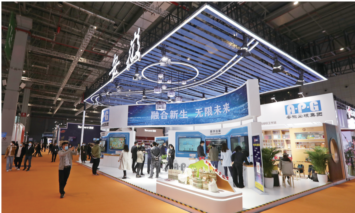
安徽出版集团展区

数字教育方面,“时代教育在线”云平台项目以“创新服务模式,共享教育资源”为建设目标,以优质数字教育资源为运营核心,提高区域教育水平,提升学生学习质量。产品目前已在安徽省16个地市全覆盖,基本实现了教育资源“校校通”“班班通”“人人通”,并在10个地市近400所学校建设完成约1600个智慧课堂班级,全面助力教育扶智、网络扶贫。豚宝学前教育STEAM智能交互课程是国内首套基于触控感应与智能交互技术开发的幼儿园全媒体电子课程,拥有7大产品体系,用户覆盖全国100多个城市5000多家终端幼儿园所。