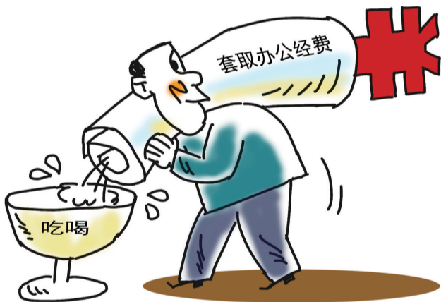
套取 ■ 罗琪(江西)