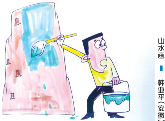
山水画 ■ 韩亚平(安徽)