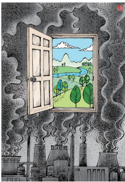
开门 ■ 杨树山(天津)