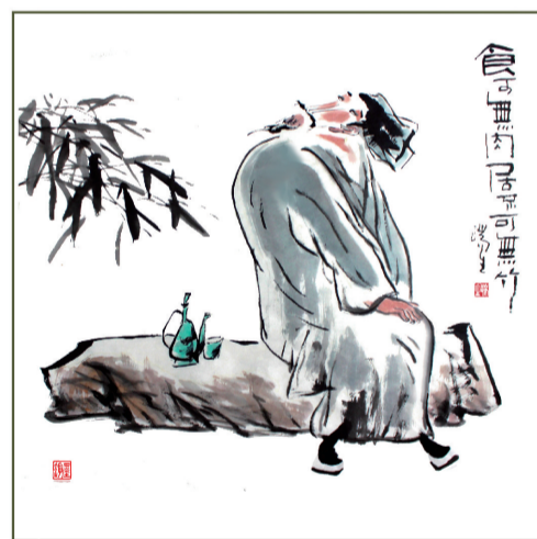
食可无肉居不可无竹 ■ 王瑞生(安徽)

作者简介:王瑞生:中国美术家协会会员、安徽省漫画艺委会副会长、安徽省特级美术教师,已发表5000余幅美术、漫画作品;多次参加全国美术、漫画作品展;在国际、国内美术、漫画大赛中获一、二、三等奖及金、银、铜奖300余次。