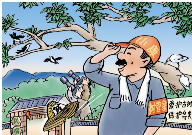
喜看旧“帽”换新颜 ■ 朱晋(江苏)