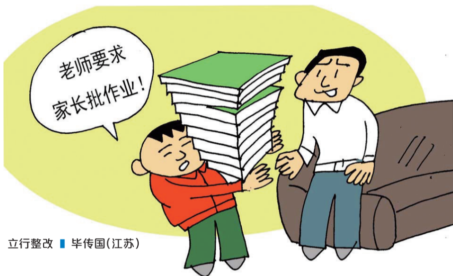
立行整改 ■ 毕传国(江苏)