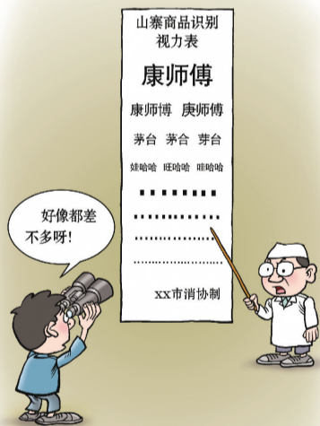
最新版视力表 ■ 傅显渝(重庆)