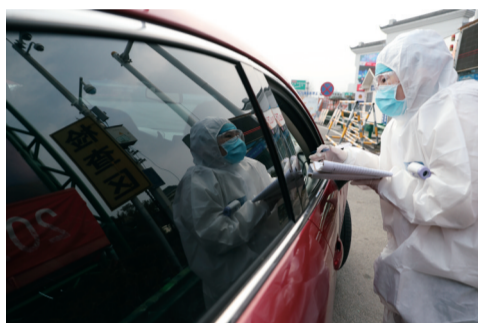
疫情期间,安徽对车辆人员开展体温检测

近日,安徽省委书记李锦斌在相关会议上指出,按照习近平总书记在安徽考察时提出的新部署新要求,深入思考12个方面问题。其中第一个问题就是如何统筹常态化疫情防控和经济社会发展,坚持外防输入、内防反弹,坚持以促促稳、以稳促进、以进促新,努力把疫情造成的损失补回来,奋力完成全年目标任务。□记者 祝亮