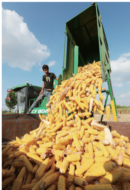
9月12日,亳州市蒙城县乐土镇李大寨村农民刚收获的玉米。

在这样的背景下疫情造成的损失如何补?省统计局相关负责人表示,下阶段,要坚持以习近平新时代中国特色社会主义思想为指导,按照党中央、国务院决策部署,做好疫情常态化防控,紧紧围绕“六稳”“六保”,狠抓政策落实,放大政策效应,多管齐下助企纾困,多措并举刺激消费,加大“两新一重”投资力度,稳住经济基本盘,保住基本民生,确保完成决战决胜脱贫攻坚目标任务,全面建成小康社会。