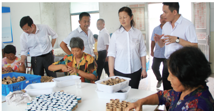
图为省药品监督管理局局长吴丽华(右三)前往丁寨社区调研

在决战决胜脱贫攻坚、全面建成小康社会的收官之年,安徽省药品监督管理局切实担当起帮扶职责,扎实开展“集中走访帮扶月”活动。局党组书记、局长吴丽华带领机关处室和直属单位人员,深入脱贫攻坚一线走访调研,通过送理念、送爱心、送产业、送项目,用实际行动和有力举措,帮助基层解难纾困,让群众从中得到实惠,确保活动取得实效。