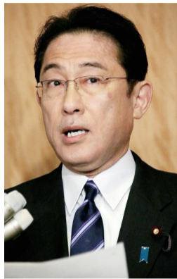
2017年4月3日,在日本东京,日本外务大臣岸田文雄在记者会上讲话。