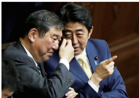
2015年7月16日,在日本东京,日本首相安倍晋三(右)在国会众议院全体会议上与地方创生担当大臣石破茂交谈。

前自民党干事长石破茂在基层党员中有较高支持,近期民意调查中连续超过安倍,被选为最合适首相人选。